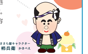
ささら屋キャラクター 柿兵衛 かきべえ

『人と人、人と自然のきづなを結ぶ』をスローガンに、富山県産米100%で作った、焼きたてのかきやま(米菓)を工場直送でお届けします。